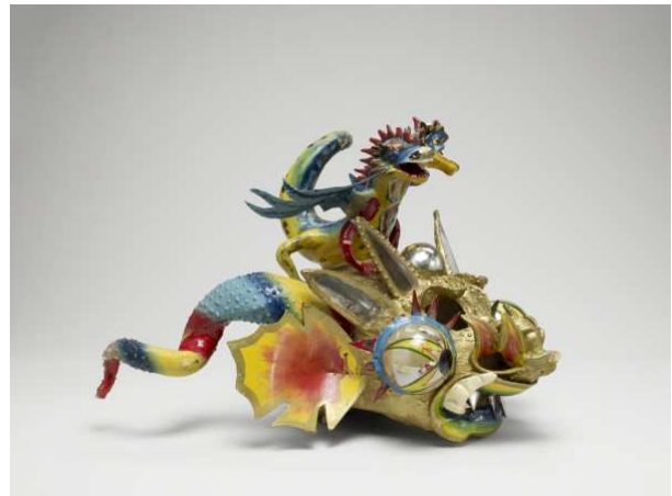
Grand masque de diablada (Bolivie)

Un tel monde, dans lequel chaque entité forme un spécimen unique , deviendrait impossible à habiter et à penser si l'on ne s'efforçait de trouver des correspondances stables entre ses composantes humaines et non humaines , comme entre les parties dont elles sont faites. Par exemple, selon les qualités qu'on leur impute, certaines choses seront associées au chaud et d'autres au froid, au jour ou à la nuit, au sec ou à l'humide. La pensée analogiste a donc pour objectif de rendre présents des réseaux de correspondance entre les éléments discontinus , ce qui suppose de multiplier les composantes de l'image et de mettre en évidence leurs relations .